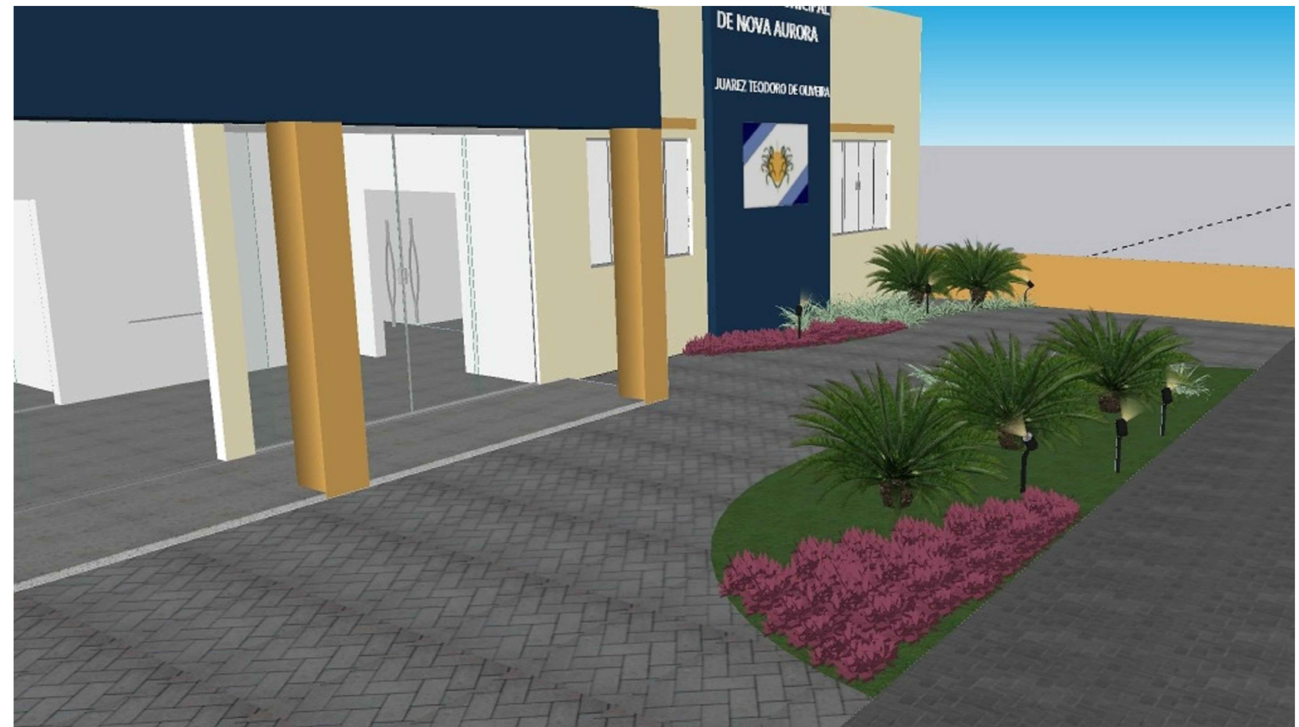
PERSPECTIVA 3 S/ESC