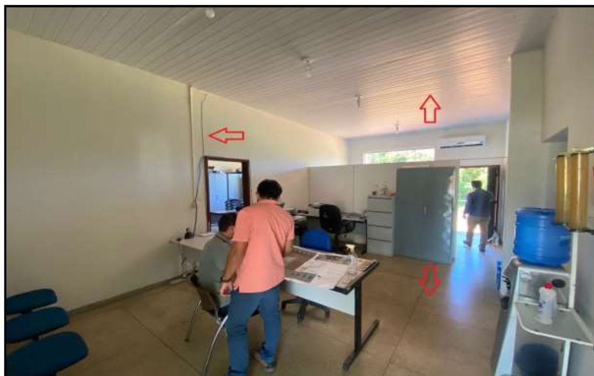
OBRA: CÂMARA MUNICIPAL DE NOVA AURORA DESTAQUE: PISO ENCARDIDO, FIAÇÃO EXPOSTA E FORRO PVC COM DEFEITO AMBIENTE: RECEPÇÃO Foto: 07