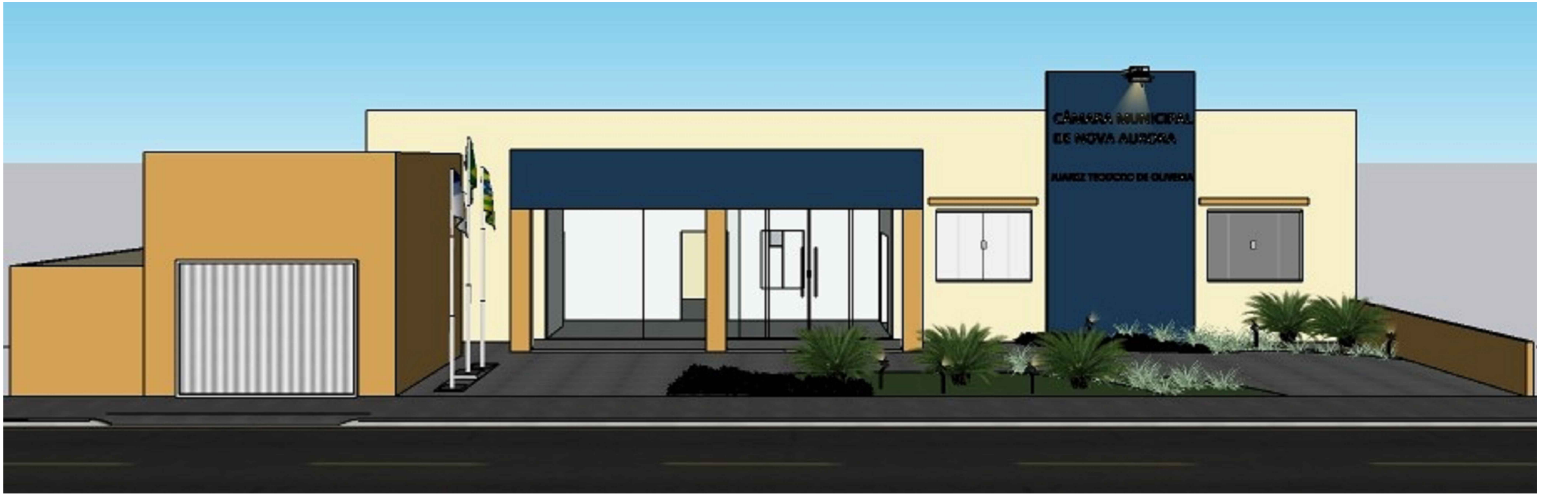
PERSPECTIVA FRONTAL 1 S/ESC